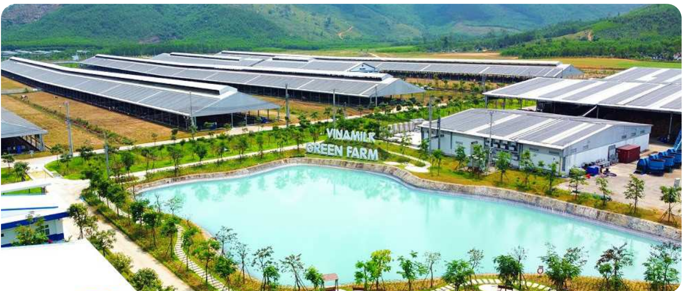
Hệ thống điện mặt trời áp mái tại Vinamilk Green Farm Quảng Ngãi

Với kết quả kinh doanh như trên, kết thúc Q3/2024, BCG Energy đã hoàn thành lần lượt 67,7% kế hoạch doanh thu và 98,2% kế hoạch lợi nhuận sau thuế đã trình tại ĐHĐCĐ. Dự phóng trong năm 2024, kết quả kinh doanh của BCG Energy sẽ tiếp tục tăng trưởng tích cực nhờ hoàn tất thủ tục đưa vào vận hành thương mại thêm 21 MW dự án điện mặt trời Krong Pa 2 (GĐ 1). Bên cạnh đó, các dự án điện mặt trời áp mái đang vận hành cũng được hưởng lợi từ chính sách điều chỉnh giá điện tăng 4,8% từ tháng 10/2024. Sở hữu danh mục áp mái đang vận hành lên đến 75 MW, BCG Energy dự kiến hoàn thiện tối thiểu 15 MW trong năm 2024 và 150 MW trong những năm tiếp theo. Với những yếu tố vĩ mô thuận lợi và những tín hiệu phục hồi tích cực, Công ty đã và đang tiếp tục tăng tốc thực hiện những kế hoạch kinh doanh đã đề ra để hoàn thành mục tiêu kinh doanh của năm.